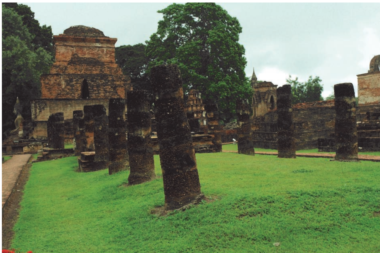
Sukhothai, Thailand.

Digerito lo stordimento causato dal battage pubblicitario costruito da certe organizzazioni sulla presunta necessità di trattare la pelle con prodotti "naturali", attestato che nella Normativa che regola la produzione e la commercializzazione dei prodotti cosmetici non è presente alcuna definizione di "prodotto naturale", verificato che le regole di comodo ad oggi impiegate per imporre una definizione in tal senso sono a dir poco opinabili ed appurato