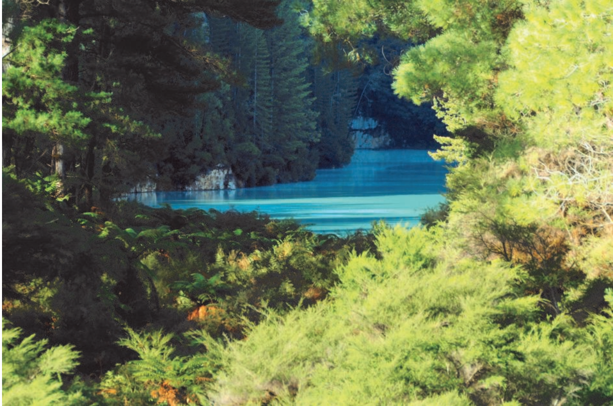
© 2008. Vincenzo Rialdi. Wai-O-Tapu, New Zealand.

che per Cosmesi viene intesa «l'arte e la tecnica che mira a conservare la freschezza e la bellezza del corpo», la Cosmesi Naturale non è certo da intendersi quella che impone nel prodotto finito l'impiego limitato agli ingredienti provenienti dal regno vegetale, bensì quella che come fine ultimo ha il mantenimento dell'apparato cutaneo nella sua normalità sotto il profilo anatomico, fisiologico e biochimico.